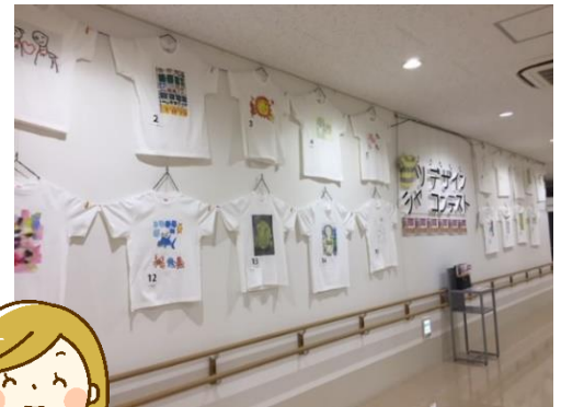
第1回の作品展示の様子