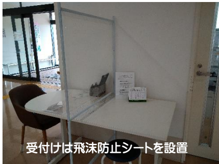
受付は飛沫防止シートを設置