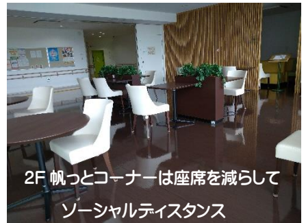
2F 帆っとコーナーは座席を減らして ソーシャルディスタンス