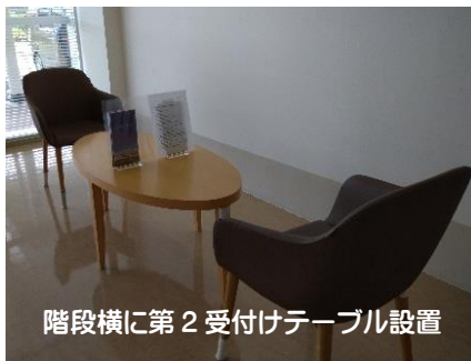
階段横に第2 受付テーブル設置