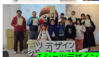
シャツデザインコンテスト優秀作品